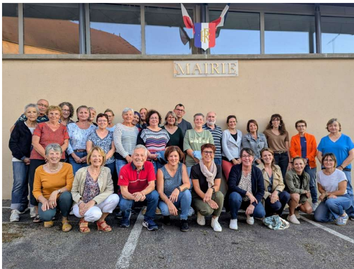
Une partie des membres de Gym Détente à l'assemblée générale du 5 SEPTEMBRE

Pour rappel : Lundi de 18h30 à 19h30 (étirement) et mercredi de 19H30 à 21H00 (cardio renforcement, gainage et assouplissement).